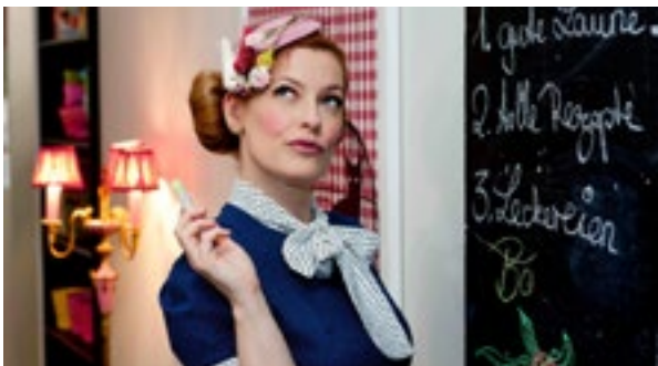
Günthart Tortendekorationen, Sweet & Easy - Enie backt/Sixx