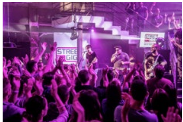
Telecom Streetgigs, GZSZ/RTL