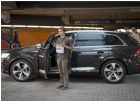
Audi, Marvel - The First Avenger