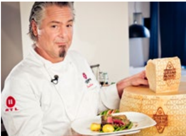
Grana Padano, Die Kochprofis - Einsatz am Herd/RTL 2