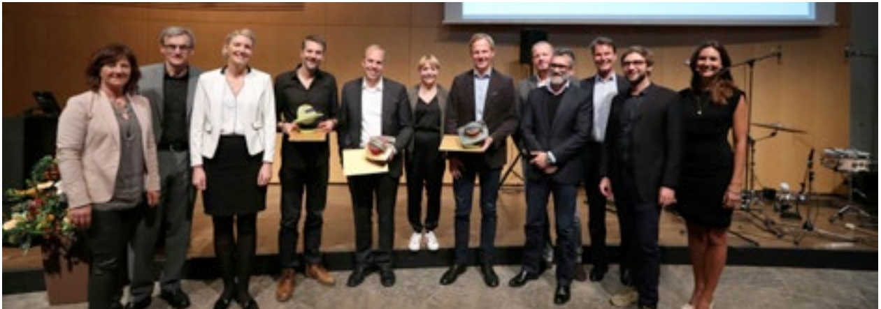
Die Preisträger des PPA 2016